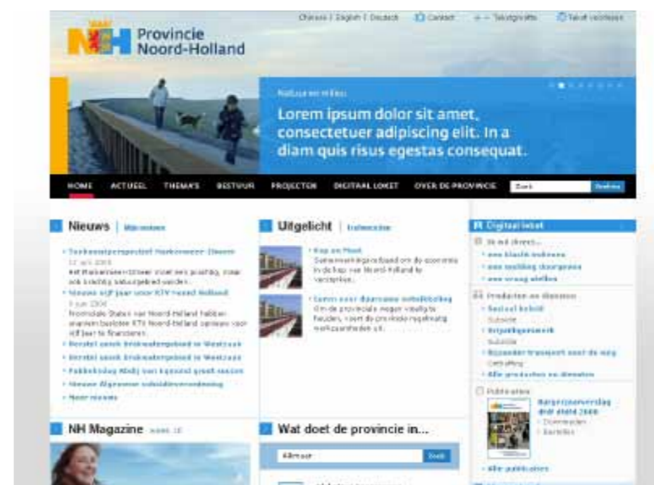
Hiernaast een eerste impressie van de vernieuwde website

Mail naar info.communicatie@noord-holland.nl of bel 5602.